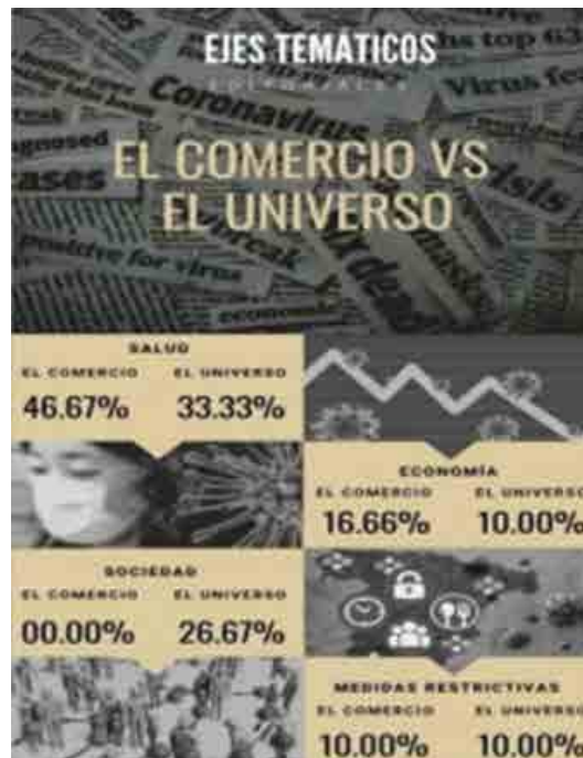
Figura 3: Ejes temáticos: El Comercio vs El Universo

En relación a la primera, se notó que en los editoriales se destaca el impacto del Covid-19 en el sector de la salud, economía, sociedad, gubernamental y educativo, acompañado de las medidas o acciones que tanto los grupos de poder como los demás estaban aplicando para reducir contagios y reactivar a la población, lo cual se traduce en comentarios políticos con diferentes percepciones, pero prudentes. “Más allá de su lugar como intermediarios entre los hechos y las audiencias, los medios de comunicación son actores políticos con intereses particulares que se mueven en un campo atravesado por relaciones de poder” (Califano 2015:63).