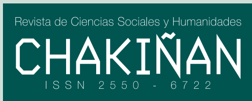
Figura 1: Logotipo de la Revista Chakiñan