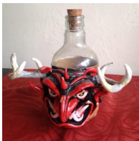
Figura 2: Botella del diablo (varios 2014). Colección: Colectivo La Minga