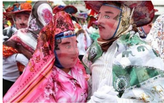
Figura 3: Comparsa con caretas: parejas de línea y capariche

La guaricha, de igual manera, tapa su rostro con pañuelos y caretas de alambre, como utilizaría puede llevar un arial, una cartera o un muñeco de felpa, ya sea de representación humana, animal o fantasía; este por lo regular es descuidado, sucio o desnudo. Por otra parte, el capariche, cubierto con careta de alambre y guantes blancos, lleva una escoba de gran tamaño confeccionada con retama negra y seca propia de la zona, sus dimensiones oscilan entre los 90 a 100 cm, la parte inferior y el palo que los sujeta de unos 50 cm llega a medir entre 140 a 150 cm; en ocasiones las decoran con cintas y flores. Las parejas de línea, hombres y mujeres, tienen un pañuelo blanco que lo agitan durante la danza, no poseen utilería, pero su coreografía es preparada por semanas antes de la festividad.