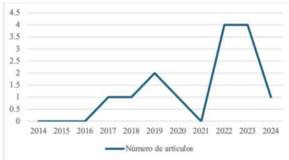
Figura 3: Años de publicación

Por otro lado, los artículos del corpus se publicaron en años recientes (figura 3). El rango que comprende las publicaciones es de 2017 a 2024, es decir, de 2014 a 2016 no se encontraron estudios empíricos que reporten estrategias educativas interculturales en primarias de Latinoamérica. En los últimos dos años (2022 a 2024) hubo mayor producción del tema: 64 % (n=9). El apogeo se dio en los años 2022 (n=4; 28.57 %) y 2023 (n=4; 28.57 %), mientras que en 2021 no hubo publicaciones al respecto.