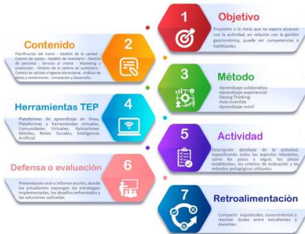
Figura 3: Descripción de fases de la estrategia pedagógica