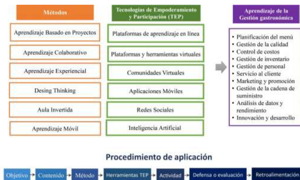
Figura 2: Estrategia pedagógica

A partir de la información recopilada, analizada y sintetizada de las fuentes bibliográficas de la sección previa, se estructuró la guía metodológica mediante las TEP para la enseñanza de la gestión gastronómica. La Figura 2 presentan los elementos fundamentales y las fases propuestas.