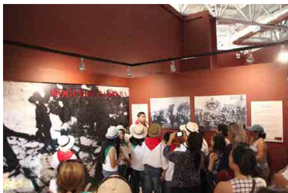
Figura 4: Recorrido de alumnos guayaquileños por el Museo Histórico “Memorias de la Revolución Liberal Radical” (julio de 2016)